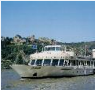
MS ASBACH, MS LORELEY