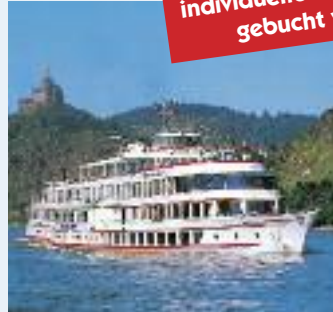
MS WAPPEN VON KÖLN