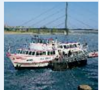
MS HEINRICH HEINE