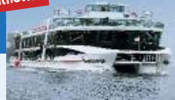
MS RheinEnergie, MS RheinFantasie

Alle Schiffe können für individuelle Charterfahrten gebucht werden!