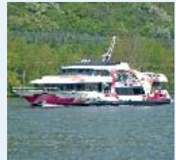
MS BUGA KOBLENZ 2011