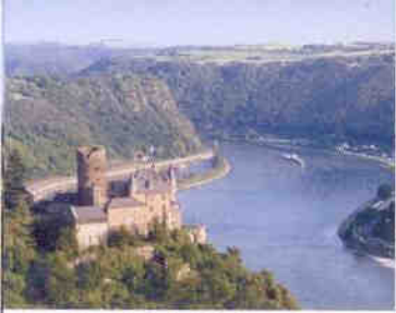
Burg Katz bei St. Goarshausen