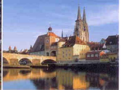
Der Regensburger Dom