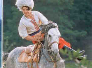
Kosakenreitspiele in Chortitsa