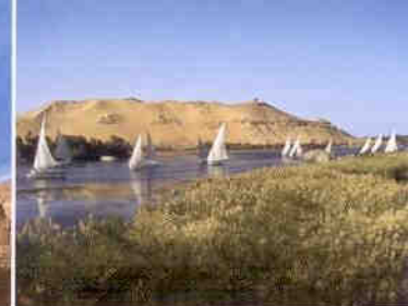
Feluken auf dem Nil bei Assuan