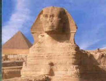
Die berühmte Sphinx von Giseh