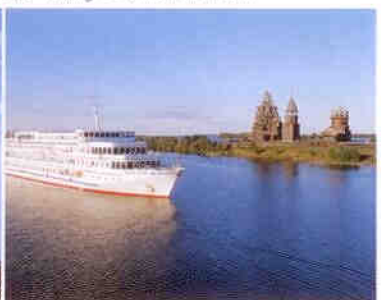
Die Viking Peterhof vor Kishi