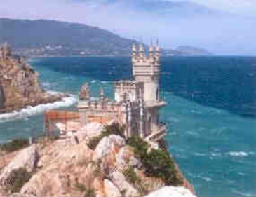
Jalta: das „Schwalbennest“