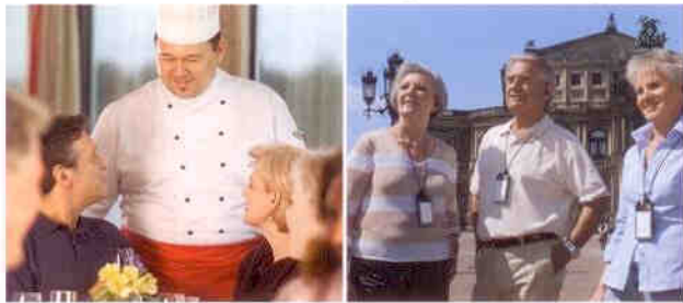
Lassen Sie sich an Bord verwöhnen: Ausflüge mit dem Audio-System